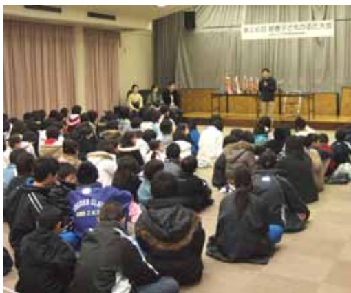
新春かるた大会(会長あいさつ)