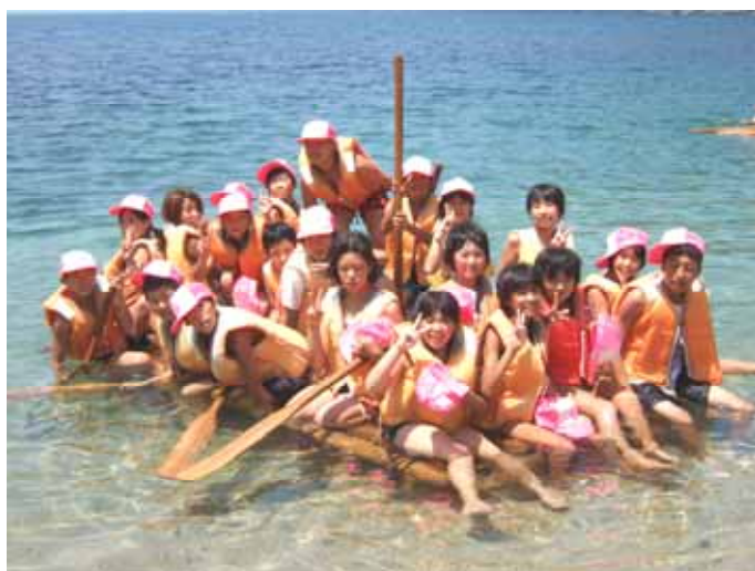
アドベンチャーキャンプ(いかだ乗り)