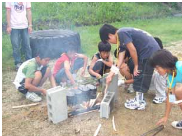
アドベンチャーキャンプ事前研修 (飯ごう炊さん)