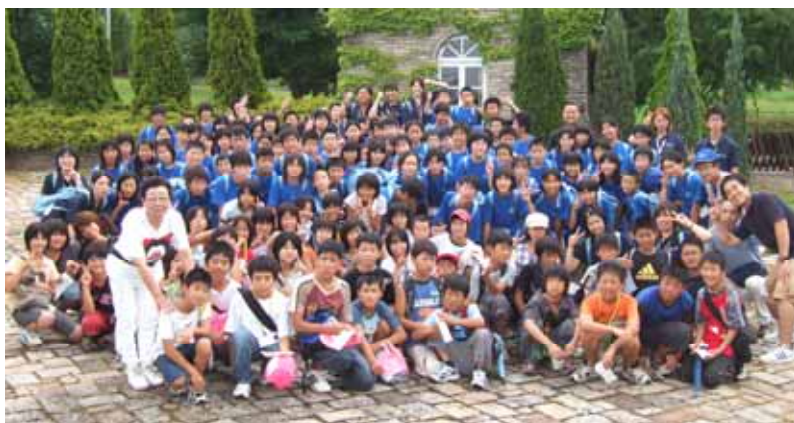
アドベンチャーキャンプ事後研修 (会津若松市子ども会との交流)