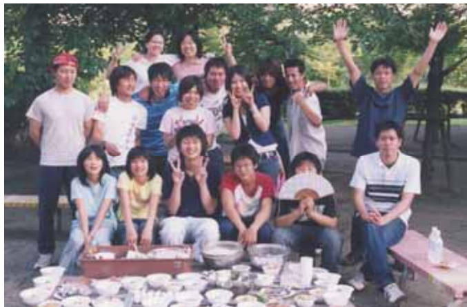
中高生リーダー研修(料理作り)

日野町子ども会指導者連絡協議会は、各単位子ども会および地区から推薦を受けた理事(現在17名)で構成され、地区子ども会指導者相互の連絡と協議をはかり、指導者の資質の向上と子ども会の育成に寄与することを目的に活動している。主な活動として、安全会勧誘の説明、中高生リーダー育成研修、学区を越えた子ども達の交流を図る自然体験アドベンチャーキャンプ、新春かるた大会、更には本年度から実施した各単位子ども会へ遊びを提供する遊びの出前を実施している。日野町の未来を背負う子ども達の健全育成を願い、地域に根ざした幅広い活動を行っている。